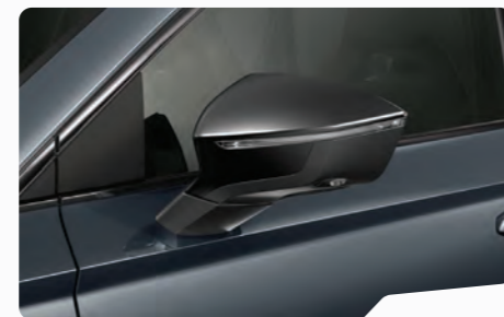
אפור מטאלי S7S7