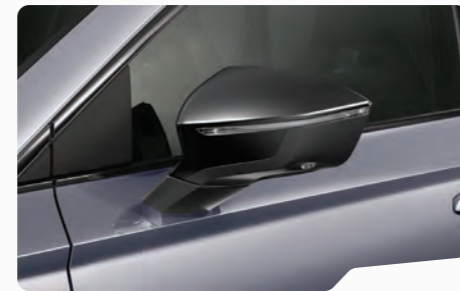
כסף מטאלי L5L5