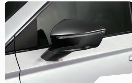
לבן נבדה 2Y2Y