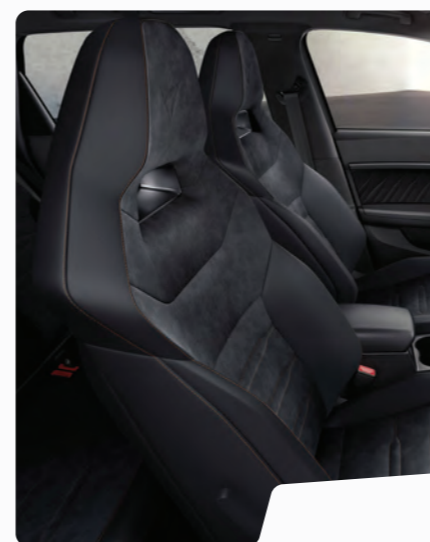
מושב באקט בד