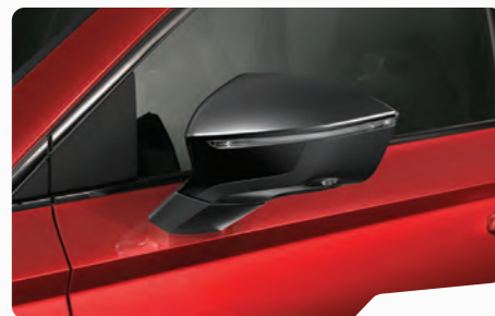
אדום כהה יין E1E1