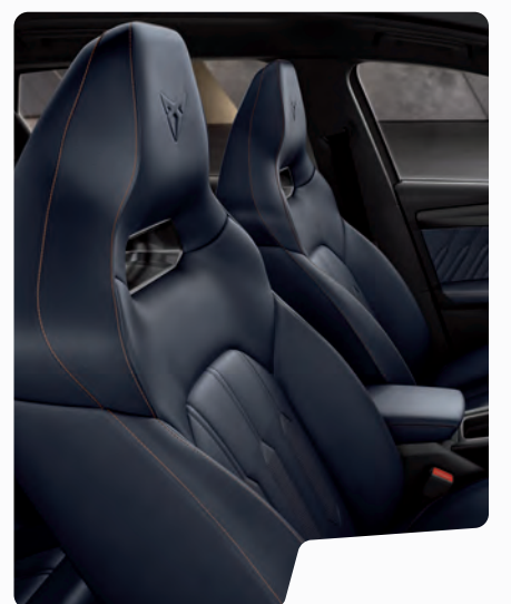
מושבי באקט עור כחול