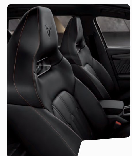
מושבי באקט עור שחור