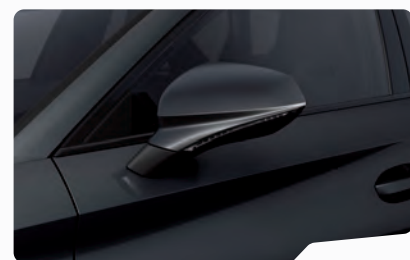
אפור מטאלי S7S7