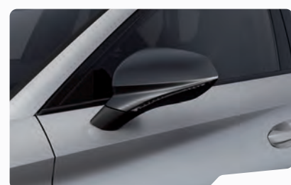
כסוף מטאלי L5L5