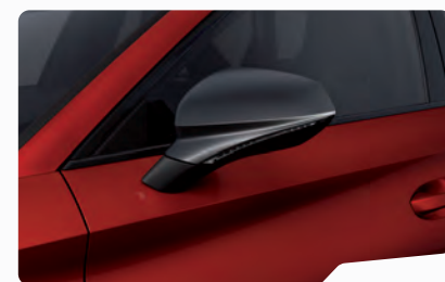
אדום כהה יין E1E1