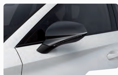
כבן נבדה 2Y2Y