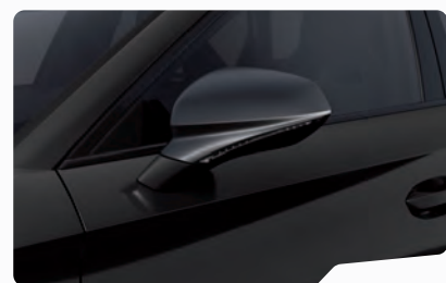
שחור מטאלי OE0E